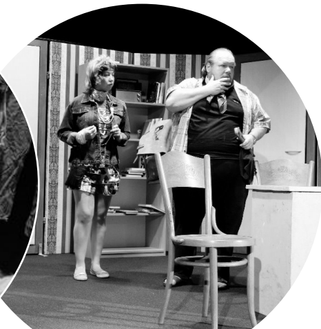
Dnes hrajeme Jo, není to jednoduché