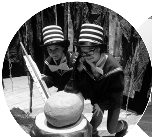
Dnes hrajeme Drak pro princeznu