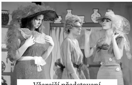
Včerejší představení Popelka