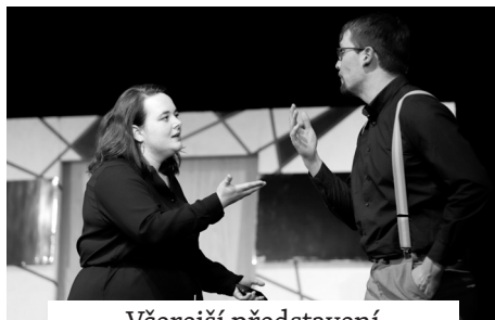
Včerejší představení Grönholmova metoda