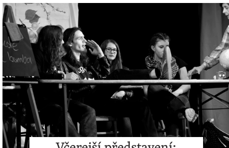
Včerejší představení: Ve škole je bomba