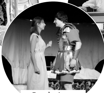
Dnes hrajeme: Velice hojný Fénix