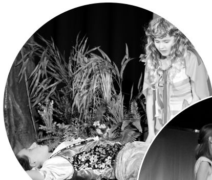
Dnes hrajeme: O malé hastrmance