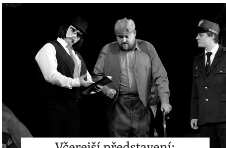
Včerejší představení: Švestka