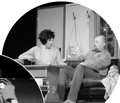
Dnes hrajeme: Na tohle teď není ta pravá chvíle