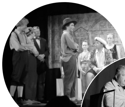
Dnes hrajeme: Bylo nás pět