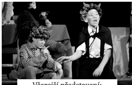
Včerejší představení: Taneček přes dvě pekla