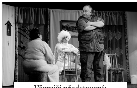
Včerejší představení: Postel pro anděla