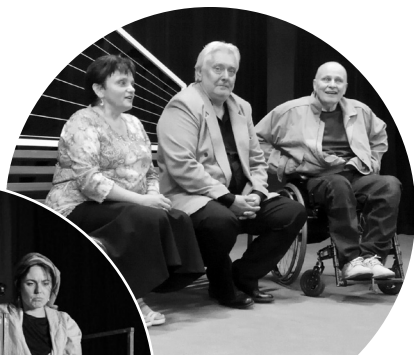
Dnes hrajeme: Tři na lavičce