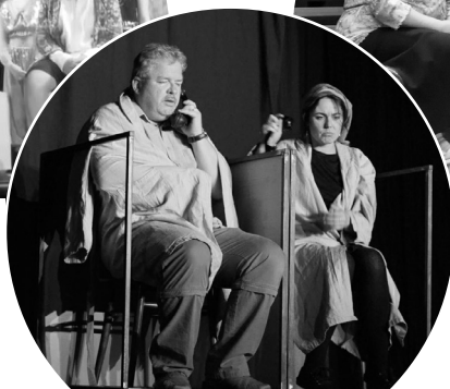
Dnes hrajeme: Skřivani už jen v Shakespearovi