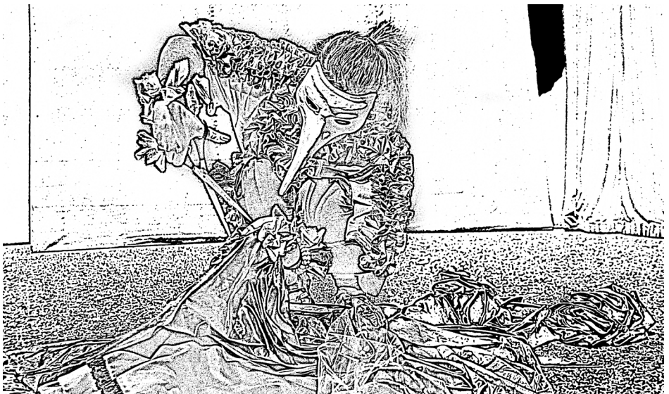
Pumpalík hrající si s nůžkami v kostyméřně.

Výňatek z knihy O Pumpalících napsal a ilustroval P. P.