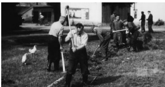
Výkop základů pro stavbu kulturního domu v roce 1957