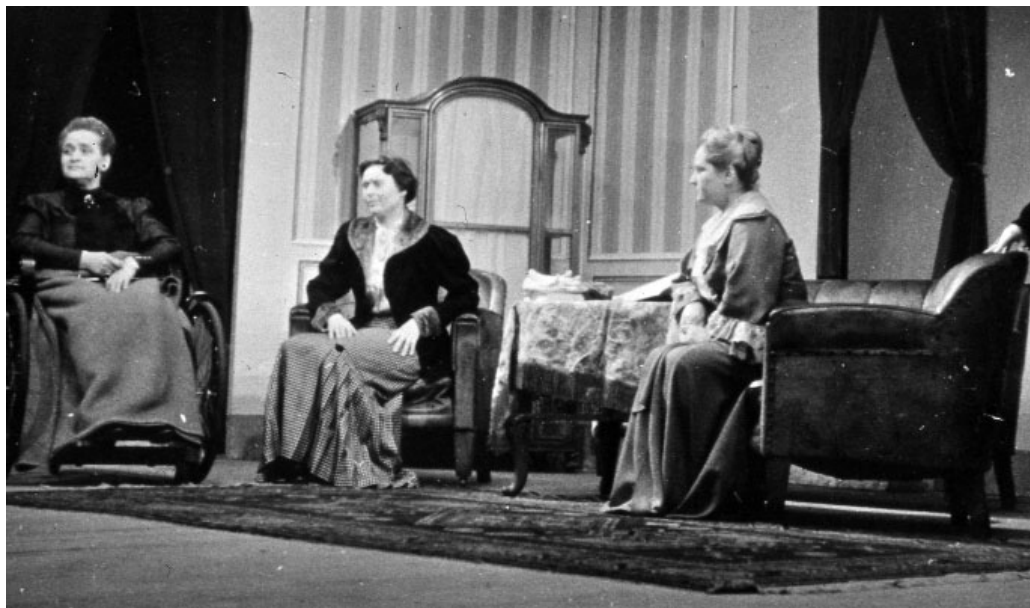
Třeštská ochotníci odehráli na 1. ročníku TDJ hru Paní Kalafová .