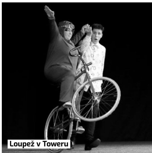
Loupež v Toweru