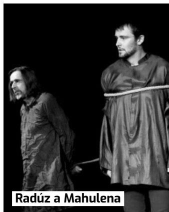
Radúz a Mahulena