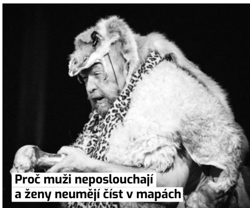
Proč muži neposlouchají a ženy neumějí číst v mapách