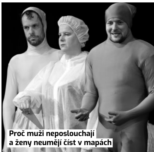
Proč muži neposlouchají a ženy neumějí číst v mapách