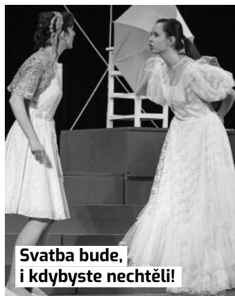
Svatba bude, i kdybyste nechtěli!