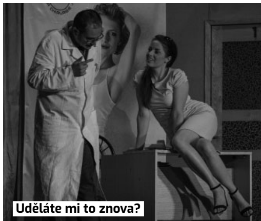
Uděláte mi to znova?