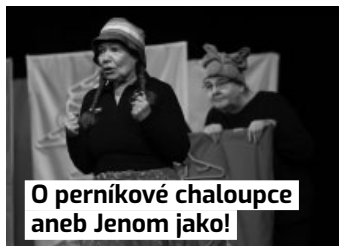
O perníkové chaloupce aneb Jenom jako!