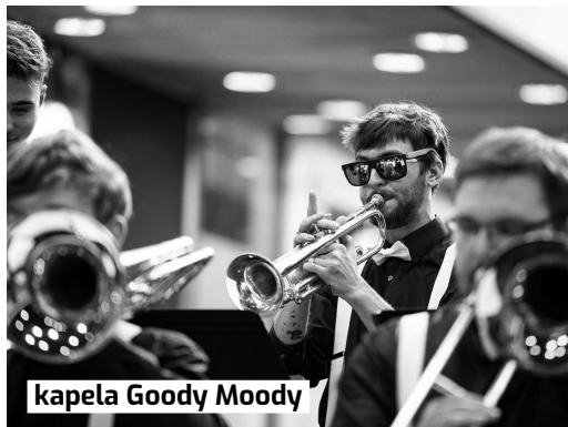
kapela Goody Moody